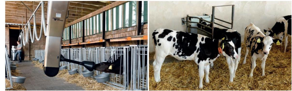
Approvisionner CalfRail & les lots avec un seul DAL

animal, toujours préparées à l'instant, jusqu'à 8 fois par jour. Le veau peut faire l'apprentissage de CalfRail et être ainsi nourri juste après son alimentation au colostrum. Les conditions optimales nécessaires à un élevage intensif sont ainsi réunies dès les tout premiers jours de la vie – et ce, sans la corvée des seaux.