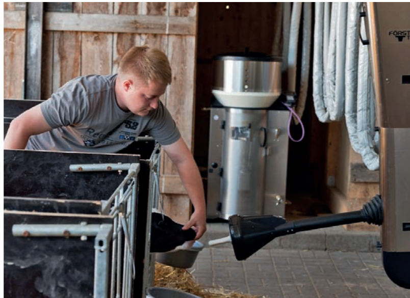
Un apprentissage simple & confortable

lite le contrôle des animaux au crépuscule et dans l'obscurité. Et qui incite de plus les veaux à boire à l'aide d'un signal acoustique.