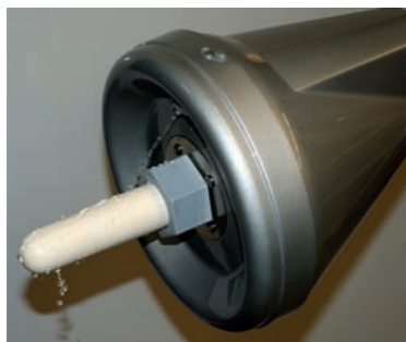
Propre jusqu'à l'extrémité

Le nettoyage automatique avant et après chaque cycle d'allaitement garantit une hygiène optimale. Comme le système ne contient pas de lait en dehors des heures de repas, les microbes ne disposent d'aucun milieu de