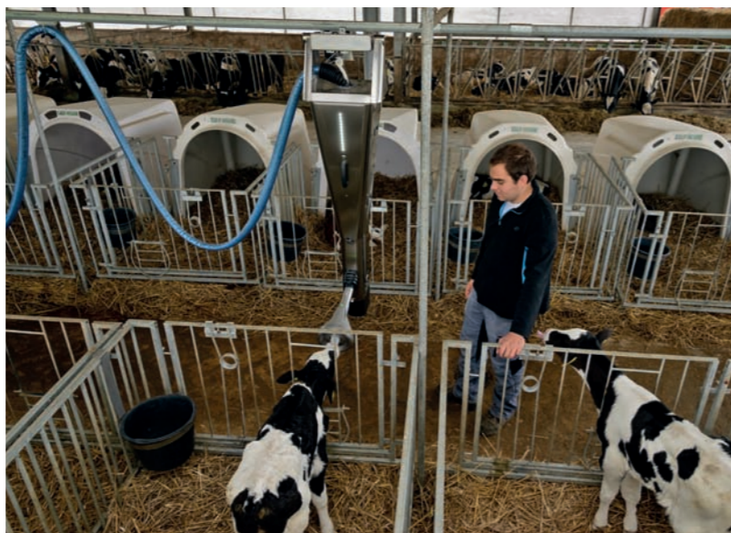
Beaucoup, souvent, toujours fraîche !